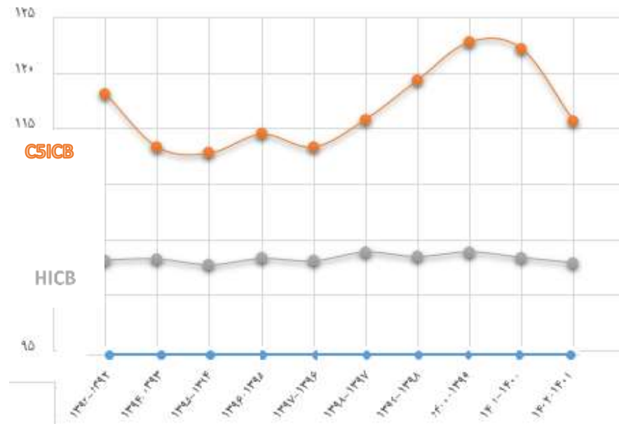
شکل ۲. مقایسه نمودار C5ICB و HICB در طی ۱۰ سال

جدول ۲، مربوط به محاسبه شاخص HHI برای سال‌های ۱۳۹۱-۱۴۰۱ سوپر لیگ بسکتبال ایران می‌باشد. بر مبنای این جدول، لیگ ۱۴۰۰-۱۴۰۱ در بهترین و مطلوب‌ترین وضعیت تعادل رقابتی قرار دارد و به تبع، لیگ ۱۳۹۹-۱۴۰۰ نامتعادل‌ترین لیگ از نقطه نظر شاخص HHI می‌باشد. جدول ۲ همچنین شاخص HICB محاسبه شده برای ده فصل اخیر لیگ برتر بسکتبال ایران را نشان می‌دهد. همانگونه که پیداست، لیگ ۱۳۹۵-۱۳۹۴ با کمترین مقدار بدست آمده، به عنوان متعادل‌ترین لیگ می‌باشد و لیگ ۱۳۹۹-۱۴۰۰ از نقطه نظر شاخص مذکور، نامتعادل‌ترین لیگ است.